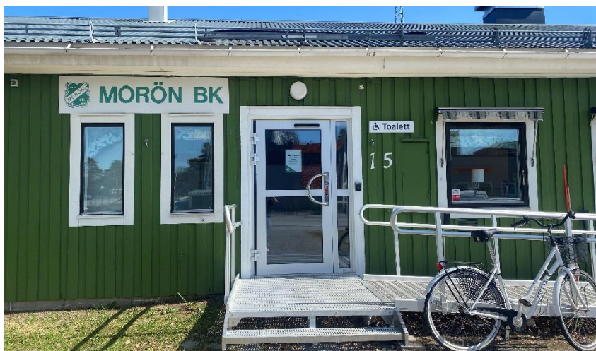
Morön BK:s kansli lokal finns på Skogsvallen