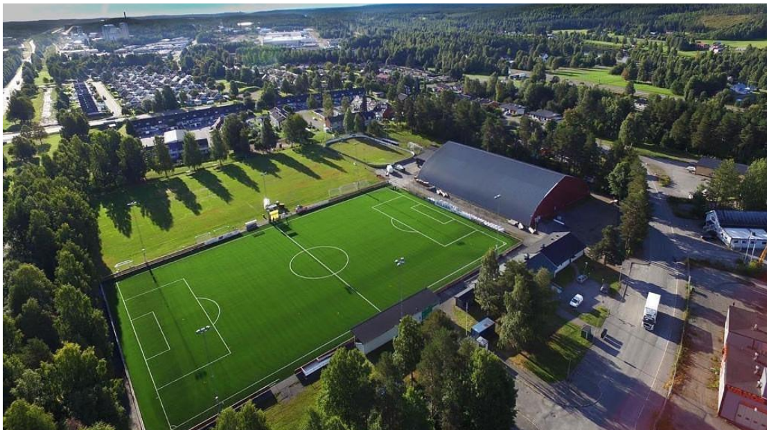
En vy över Skogsvallen med A- och B-planen samt vår föreningslokal med kansli

Föreningens seniorlag har varsitt omklädningsrum på Skogsvallen.